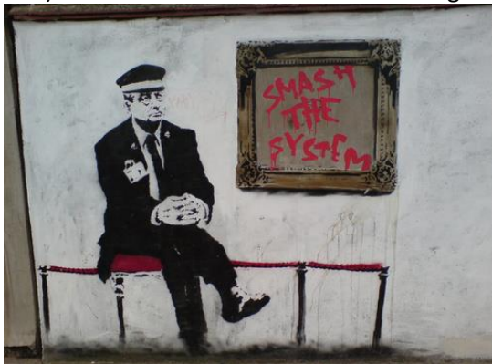
Banksy StreetArt, Highbury Stadium

Anno 2012 is onze vraag opnieuw tot welk kritisch punt een samenleving bereid is kritiek toe te laten op haar eigen grondslagen. Die vraag werd in de jaren '70 overigens ook al gesteld (Beerling, 1978, 334). Ik herhaal nu slechts diezelfde vraag.